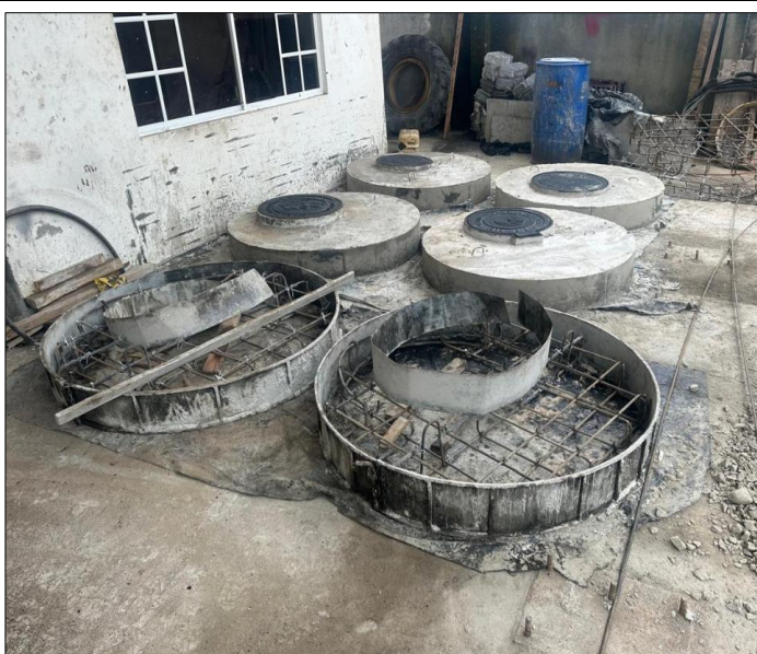
Descripción del Rubro

RUBRO N° 11 Pozo de revisión H.S. f'c=210\text{kg/cm}^2 H=1.51 - 2.00m(Tapa, Cerco,Peldaño)