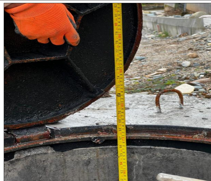
Descripción del Rubro

RUBRO N° 11 Pozo de revisión H.S. f'c=210\text{kg/cm}^2 H=1.51 - 2.00m(Tapa, Cerco,Peldaño)