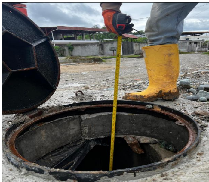
Descripción del Rubro

RUBRO N° 12 Pozo de revisión H.S. f'c=210\text{kg/cm}^2 H= 2.01 - 4.00m(Tapa, Cerco,Peldaño)