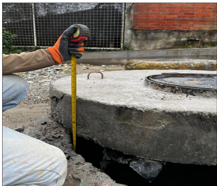
Descripción del Rubro

RUBRO N° 11 Pozo de revisión H.S. f'c=210\text{kg/cm}^2 H=1.51 - 2.00m(Tapa, Cerco,Peldaño)