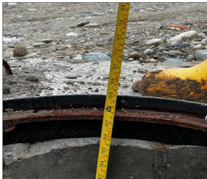
Descripción del Rubro

RUBRO N° 12 Pozo de revisión H.S. f'c=210\text{kg/cm}^2 H= 2.01 - 4.00m(Tapa, Cerco,Peldaño)