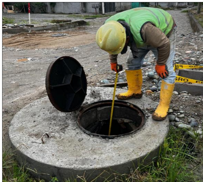
Descripción del Rubro

RUBRO N° 12 Pozo de revisión H.S. f'c=210\text{kg/cm}^2 H= 2.01 - 4.00m(Tapa, Cerco,Peldaño)