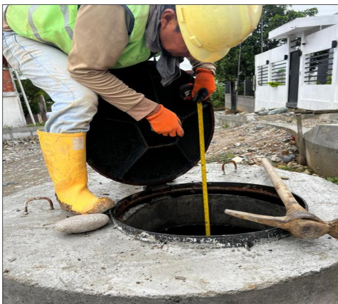
Descripción del Rubro

RUBRO N° 12 Pozo de revisión H.S. f'c=210\text{kg/cm}^2 H= 2.01 - 4.00m(Tapa, Cerco,Peldaño)