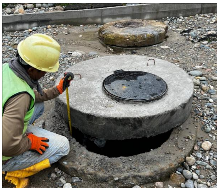
Descripción del Rubro

RUBRO N° 11 Pozo de revisión H.S. f'c=210\text{kg/cm}^2 H=1.51 - 2.00m(Tapa, Cerco,Peldaño)